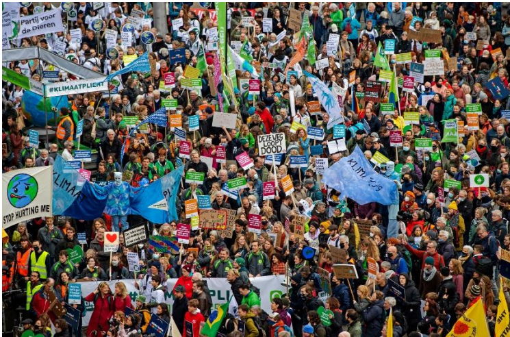
Klimaatmars Rotterdam 2022

bezighoudt. Onze partij heeft in de verkiezingsprogramma's de aanpak van de woningnood op één staan. Terecht! Maar als ik naar een demonstratie tegen de woningnood ga, tref ik daar maar mondjesmaat partijgenoten aan. De enkele roos-gebalde vuistlogo's vallen weg tussen de tientallen rode vlaggen van de SP en de NCPN. En als ik naar een demonstratie van klimaatactivisten ga, begeef ik mij in een zee van groene vlaggen van GroenLinks en D66, het paars van Volt en geel van de anti-atoomlobby. Maar het PvdA-rood legt het zelfs af tegen de vlaggen van de FNV. Hoe kan dat?