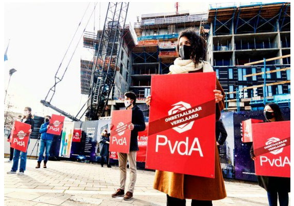
PvdA demonstratie woonkosten Utrecht 2021

Het uiten van woede is een waarde op zichzelf. Want het is niet alleen een uiting van onmacht. Het is een roep die de andere partij, de machthebbers, voor een vraag stelt: moeten we reageren of ze negeren? Daarmee zijn zij uitgedaagd tot een morele stellingname, zoals die andere filosoof van de Frankfurter Schule, Jürgen Habermas, al poneerde.